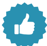
BOURSES « COUP DE POUCE »

Pour souligner votre arrivée, c'est avec enthousiasme que nous vous présentons le premier volet de notre programme de bourses : les bourses d'entrée. Il est composé de 20 bourses « Coup de pouce », 9 bourses de mérite, 2 bourses de détermination et 4 bourses d'admission, pour un total de 35 bourses totalisant 19 750 $ en subvention.