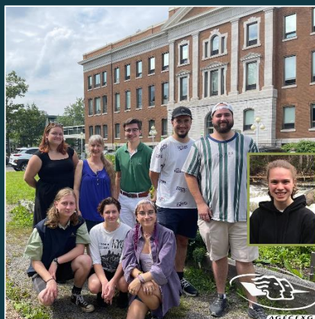
L'ASSOCIATION ÉTUDIANTE DU CÉGEP GARNEAU

CÉGEP GARNEAU Formation continue et service aux entreprises