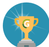
BOURSES DE DÉTERMINATION