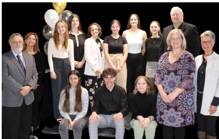
Soirée de remise de bourses 2022

Sur la photo les récipiendaires sont accompagnés de :